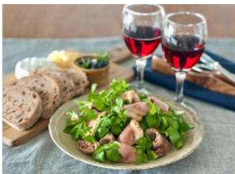
調理例：鴨とクレソンのサラダ