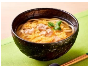
調理例：鶏肉と卵のあんかけうどん