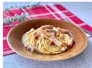
調理例：カルボナーラ